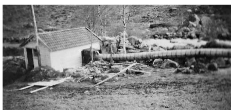
Kraftverket på Vaule bygd i 1940 for bnr. 1 og 3 i fellesskap. I drift til 1957. Turbinen kom fra Austrumdal.