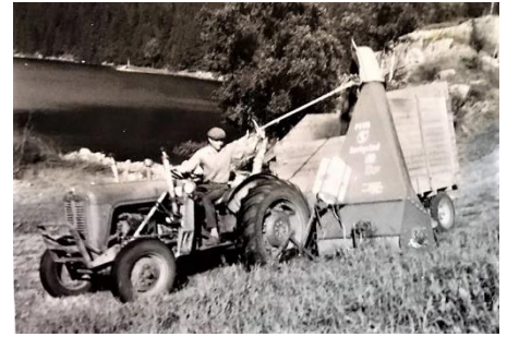
Kåre Vaule forhøster på Auseholane i slutten av 1960-åra.