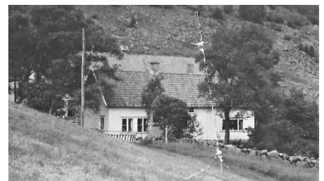
Bnr.1 heimehuset bygget på slutten av 1700-tallet. Vi ser løa bakenfor. Foto 1955.