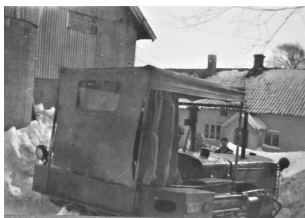
Snørydding på Vaule med bulldoseren 1955.