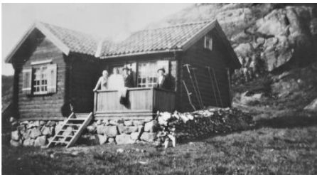
Hytta i Vauledalen fra en annen vinkel.