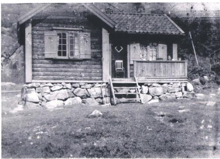
Hytta i Vauledalen 1944.