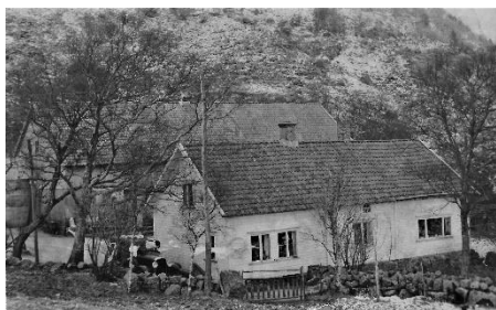
Bnr.1 heimehuset.