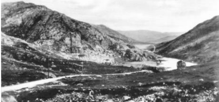
Hovedvegen over Runaskaret, sett mot Vikeså.

Nye bilder legges ut fortløpende, så følg med!