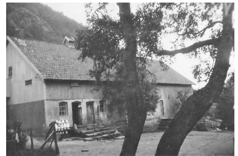
Bnr. 1 fjøset med løa bygget 1926. Foto 1955.